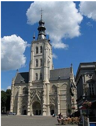
O.L.Vrouw ten Poelker