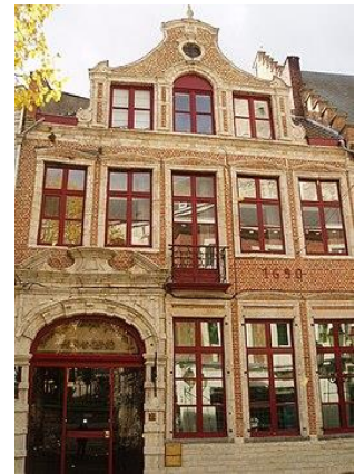
De huizen Van Ranst