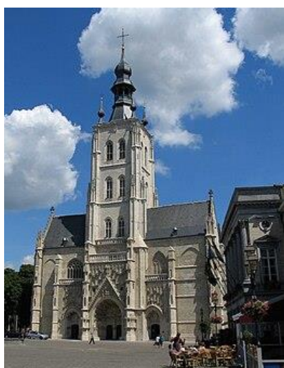
O.L.Vrouw ten Poelkerk