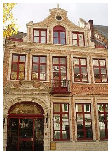
De huizen Van Ranst